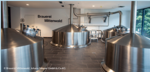
© Brauerei Mittenwald, Johann Neuner GmbH & Co.KG

Tel. +49(0)8823/1007, www.brauerei-mittenwald.de